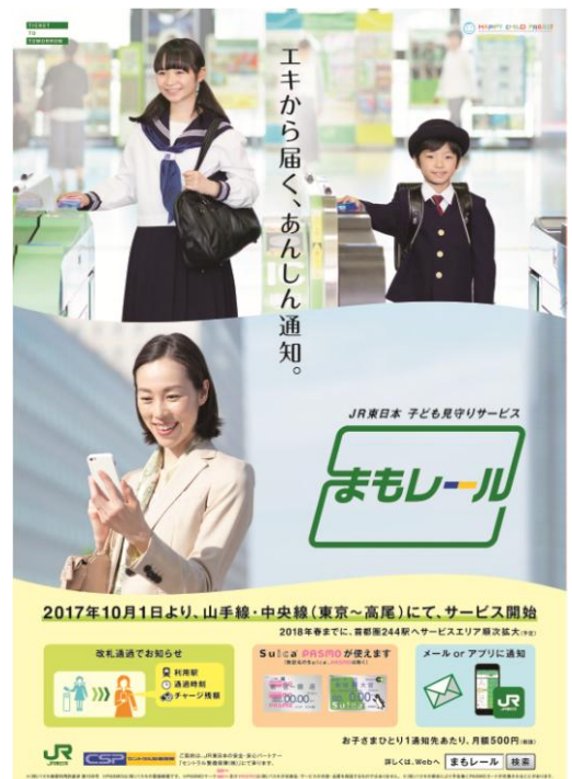
「まもレール」イメージポスター